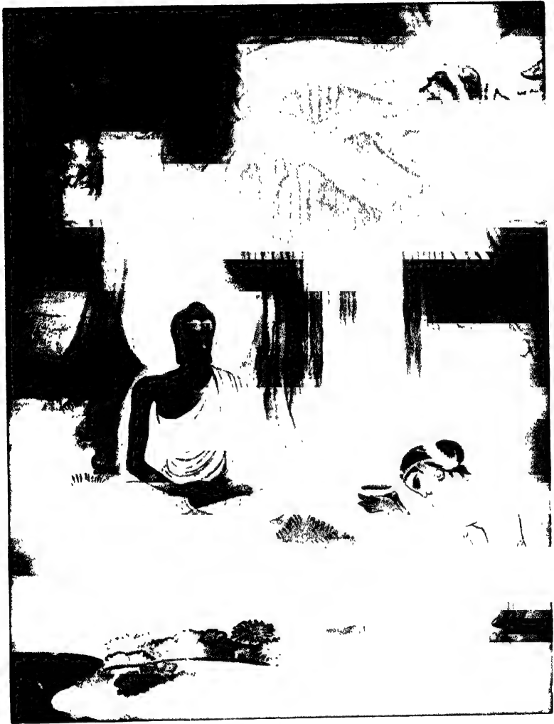
সুজাতা (নন্দা) কতুক পাষসাম দান (পৃ: ১২)